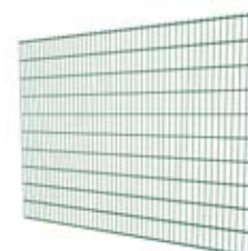
Panel Doble Hilo