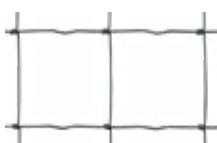
Malla HJ MRT®