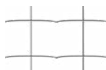
Malla soldada progresiva