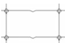
Malla FK MRT®